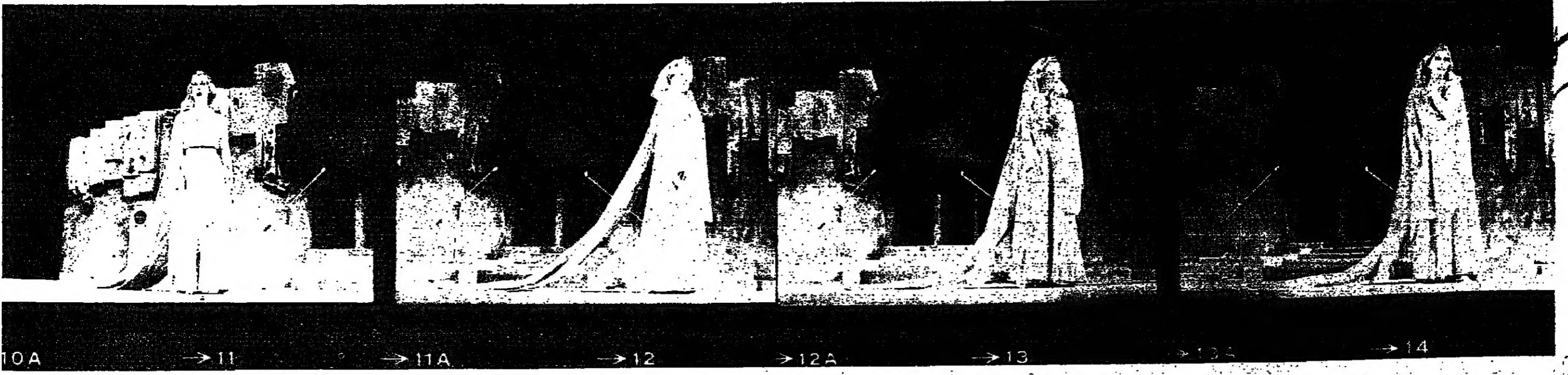
10A → 11 → 11A → 12 → 12A → 13 → 14 ■ فيروز وسط إطلال «بترا» على مسرح معروض دمشق ■